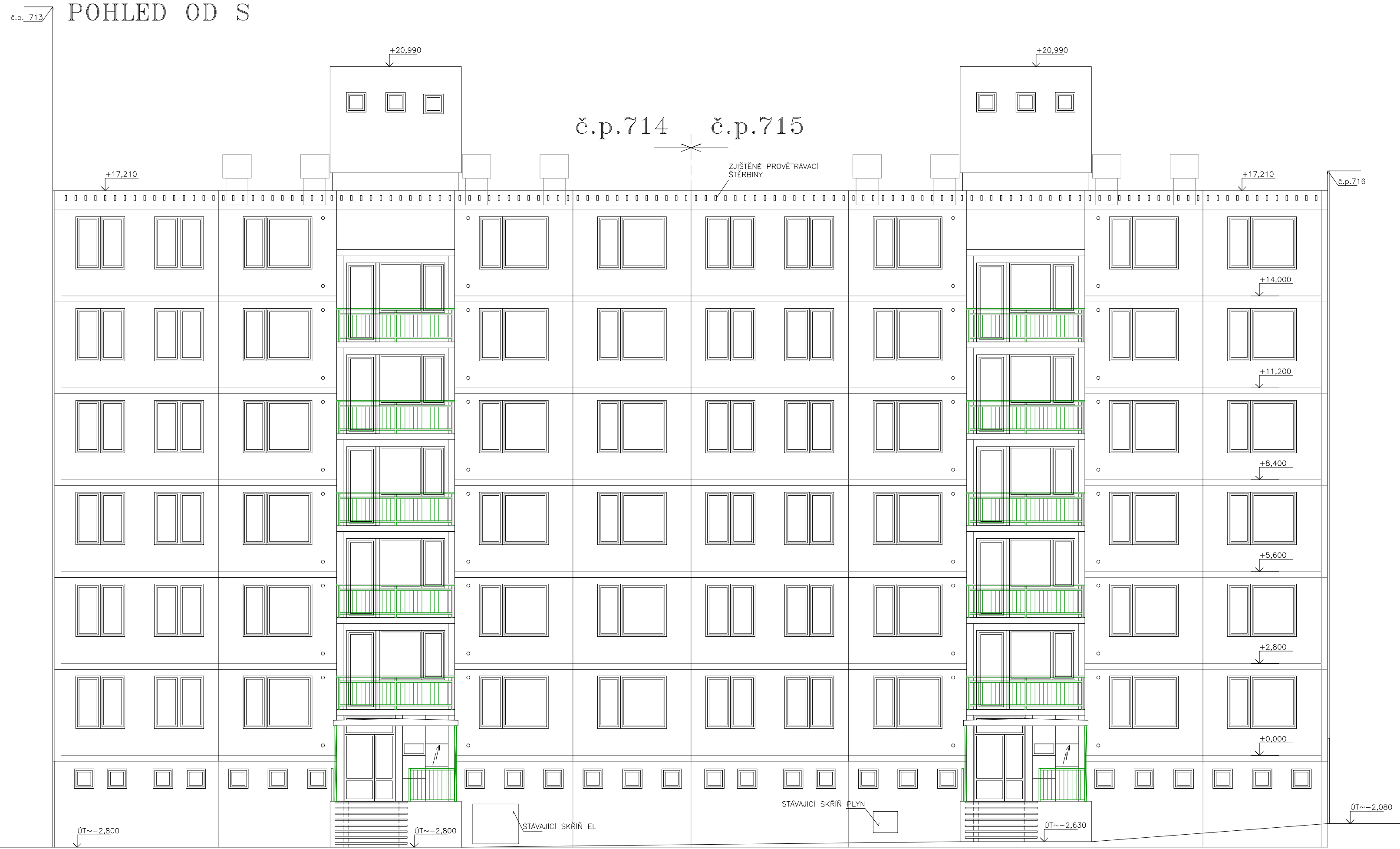
POHLED OD S